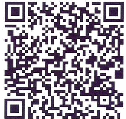
QR de Registro